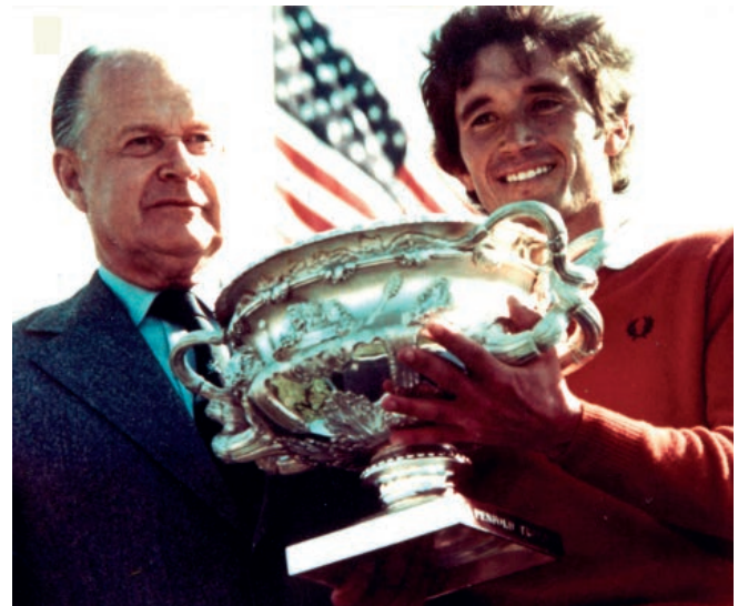
Manolo Piñero. Campeón del Mundo de Golf. California 1976. Manolo Piñero. Golf Champion. California 1976

Pero Sun Breeze no es solo localización, tanto el diseño como la construcción de su complejo residencial son el resultado de exigir siempre, un respeto por el entorno y unos altos estándares de calidad para nuestros proyectos, no solo con respecto al cuidado en el diseño, en el desarrollo o en el acabado, sino también en la elección de los materiales con los que trabajamos.